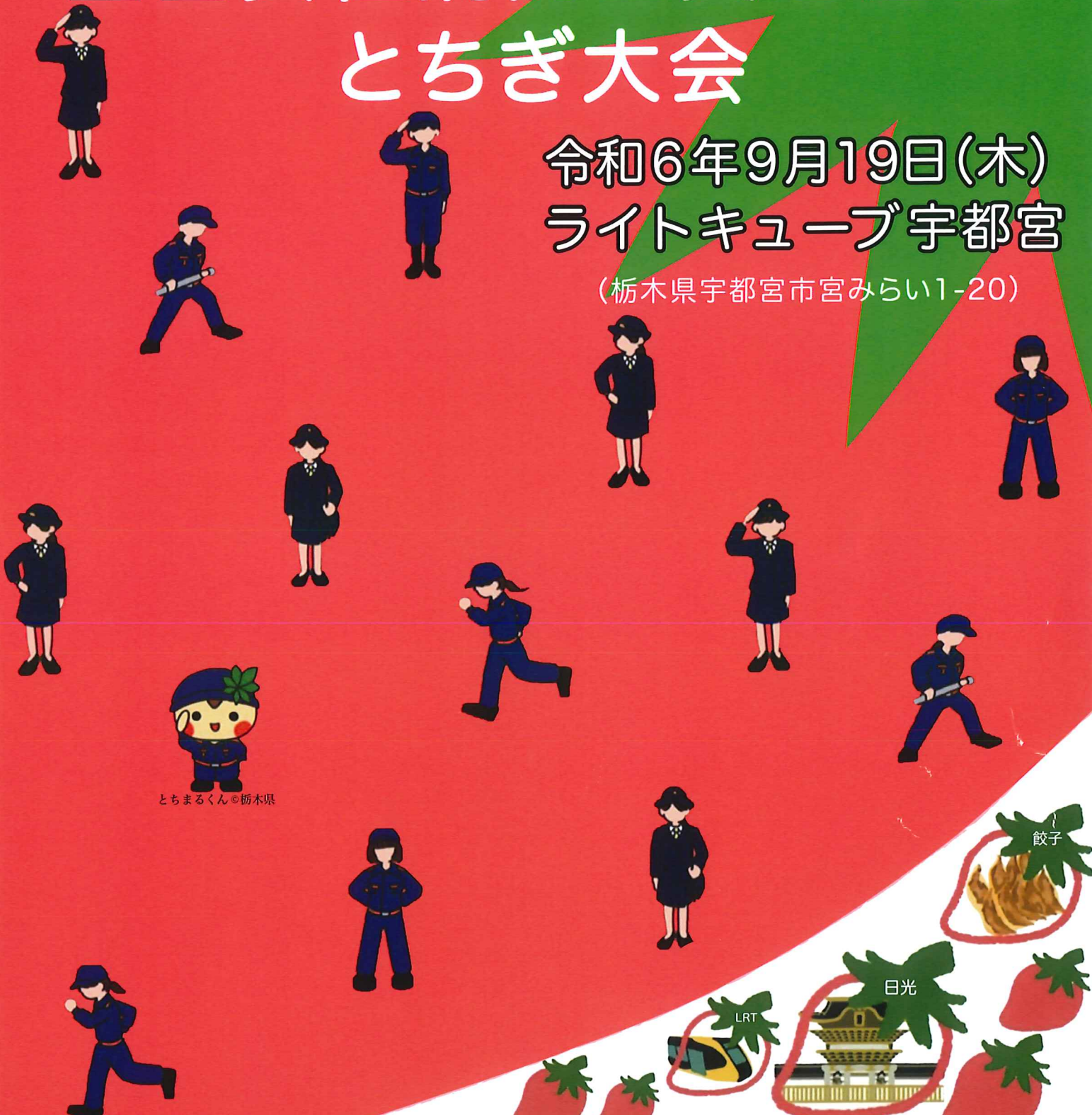
とちまるくん©栃木県